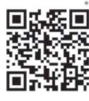
↑ キャリアアップ助成金 正社員化コース